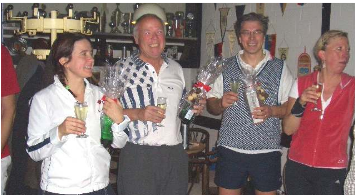
Die Finalisten nach dem entscheidenden Spiel

Nun hängt am Brett neben der Theke zwar ein Plan aus, in dem alle Heimspiele eingetragen sind, so dass man sich informieren kann.