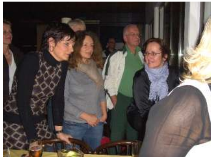
Gebannte Zuschauer beim Finale

Inzwischen schon Tradition hat das Tennis-Mixed-Turnier, das die Tennisabteilung jeden Januar in der Halle des THC in Roxel ausrichtet. Anmelden konnten sich alle Erwachsenen, ob als Paar oder alleine. Egal welcher Spielstärke – schließlich spielen wir zum Spaß (obwohl es schon von Vorteil ist, einen Aufschlag über das Netz zu bringen...!)